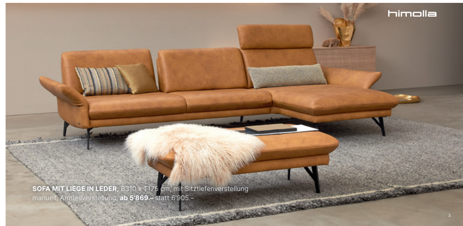
SOFA MIT LIEGE IN LEDER , B310 x T175 cm, mit Sitztiefenverstellung manuell, Armteilverstellung, ab 5'869.- statt 6'905.-