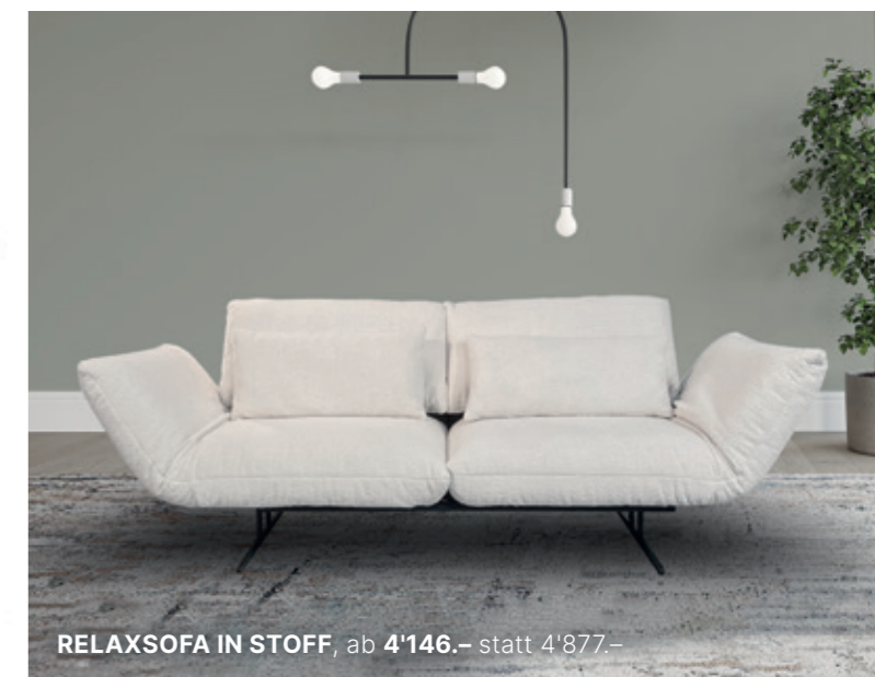
RELAXSOFA IN STOFF , ab 4'146.- statt 4'877.-