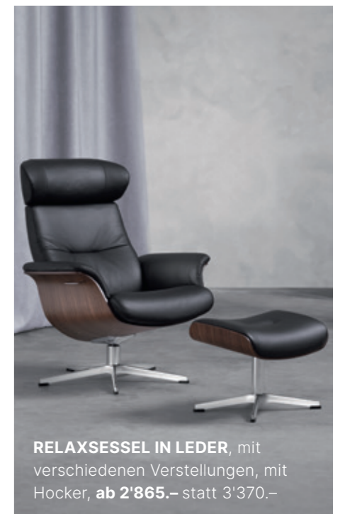
RELAXSESSEL IN LEDER , mit verschiedenen Verstellungen, mit Hocker, ab 2'865.- statt 3'370.-