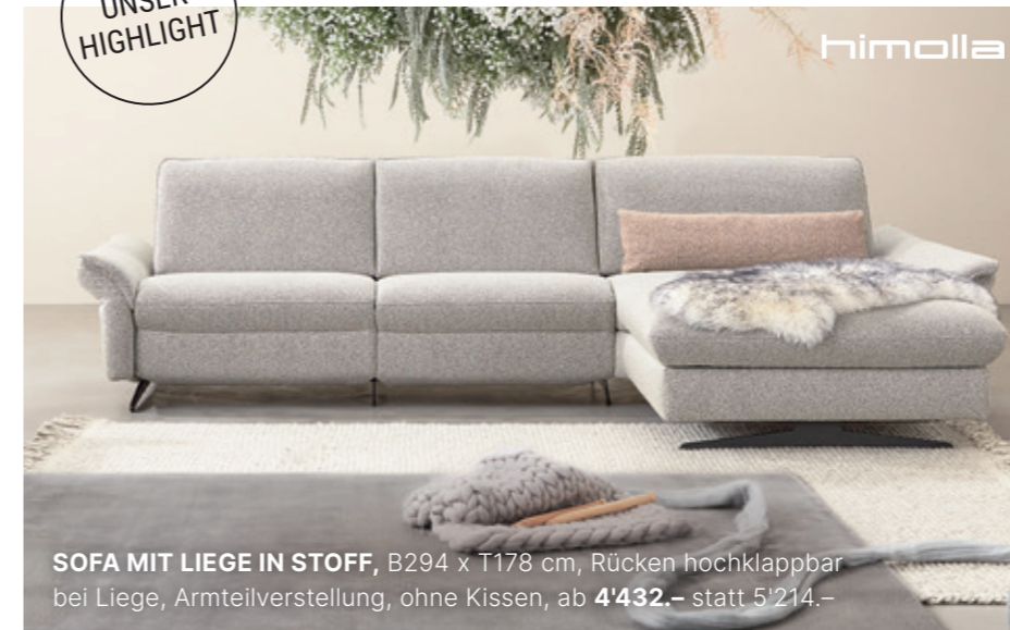
SOFA MIT LIEGE IN STOFF , B294 x T178 cm, Rücken hochklappbar bei Liege, Armteilverstellung, ohne Kissen, ab 4'432.- statt 5'214.-