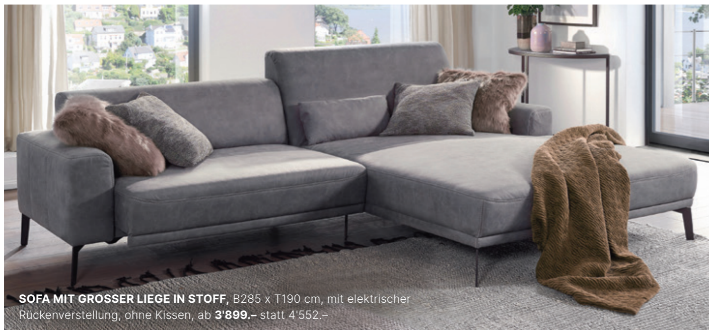
SOFA MIT GROSSER LIEGE IN STOFF , B285 x T190 cm, mit elektrischer Rückenverstellung, ohne Kissen, ab 3'899.- statt 4'552.-

Mit nur wenigen Handgriffen verwandeln sich Sofas in persönliche Rückzugsorte des Wohlbefindens. Dank flexibler Einstellungsmöglichkeiten für Kopfteile, Armlehnen, Fussstützen und Sitztiefe bieten unsere Polstermöbel mit Relax-Funktion individuellen Komfort ganz nach Ihren Bedürfnissen.