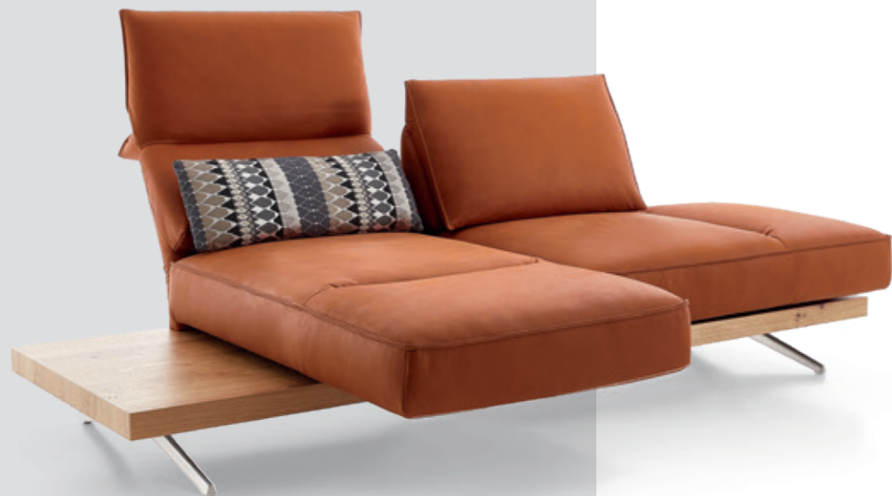
RELAXSOFA IN LEDER , mit diversen Funktionen, B240 cm, ohne Kissen, ab 6'990.- statt 8'336.-