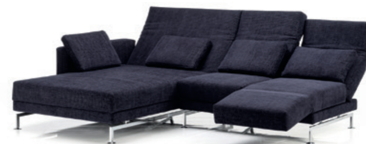
SOFA IN STOFF , B184-234 x T90-200 cm, mit 8 Verstellbarkeiten, mit Kissen, ab 4'999.- statt 5'928.-